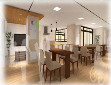
明るく家庭的な共有スペース