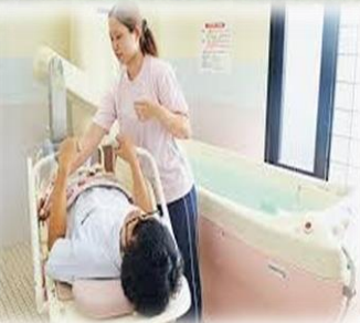
安全で快適な入浴