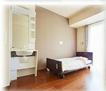
安心のICTシステム採用