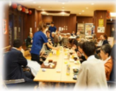
楽しい行事(写真は居酒屋※郷六の杜)